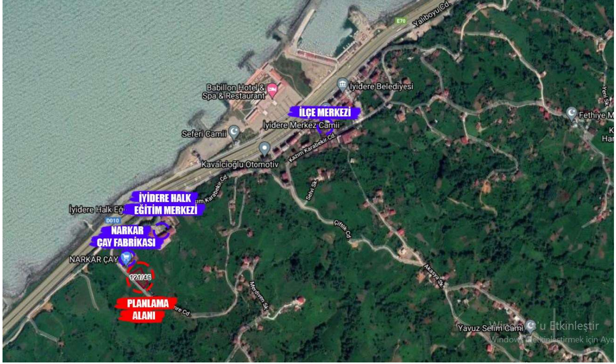
Şekil 1-Planlama Alanının Konumu

İş bu rapora konu olan planlama alanı; Rize İli, İyidere İlçesi, Fıçıtışı Mahallesi tapuda 121 ada 46 nolu parselin numarasına kayıtlı, 3° UTM Projeksiyona, ITRF96 Datum, 39 diliminde bulunan ve 1/5000 ölçekli hâlihazır paftasında bulunan taşınmazı ve bu taşınmazın hizmet alacağı teknik altyapı alanını kapsamaktadır.