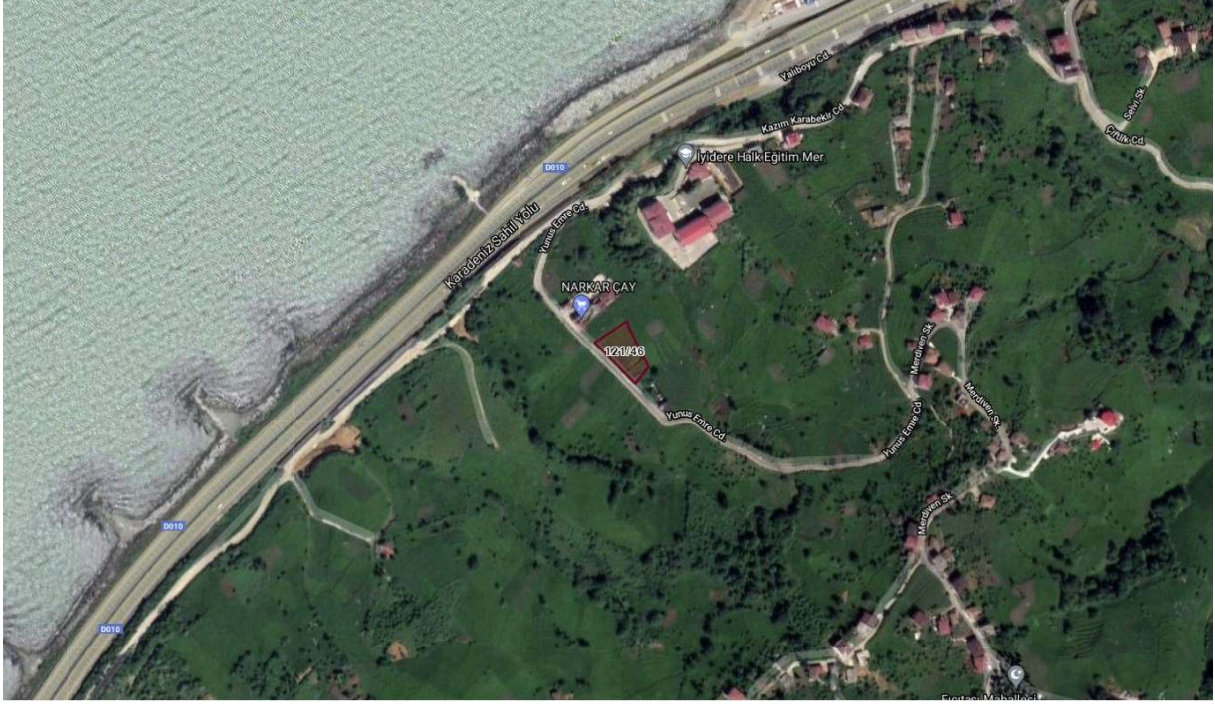
Şekil 2-Taşınmazın kadastrusu

Şekil-2'de taşınmazın kadastral durumu gösterilmektedir.